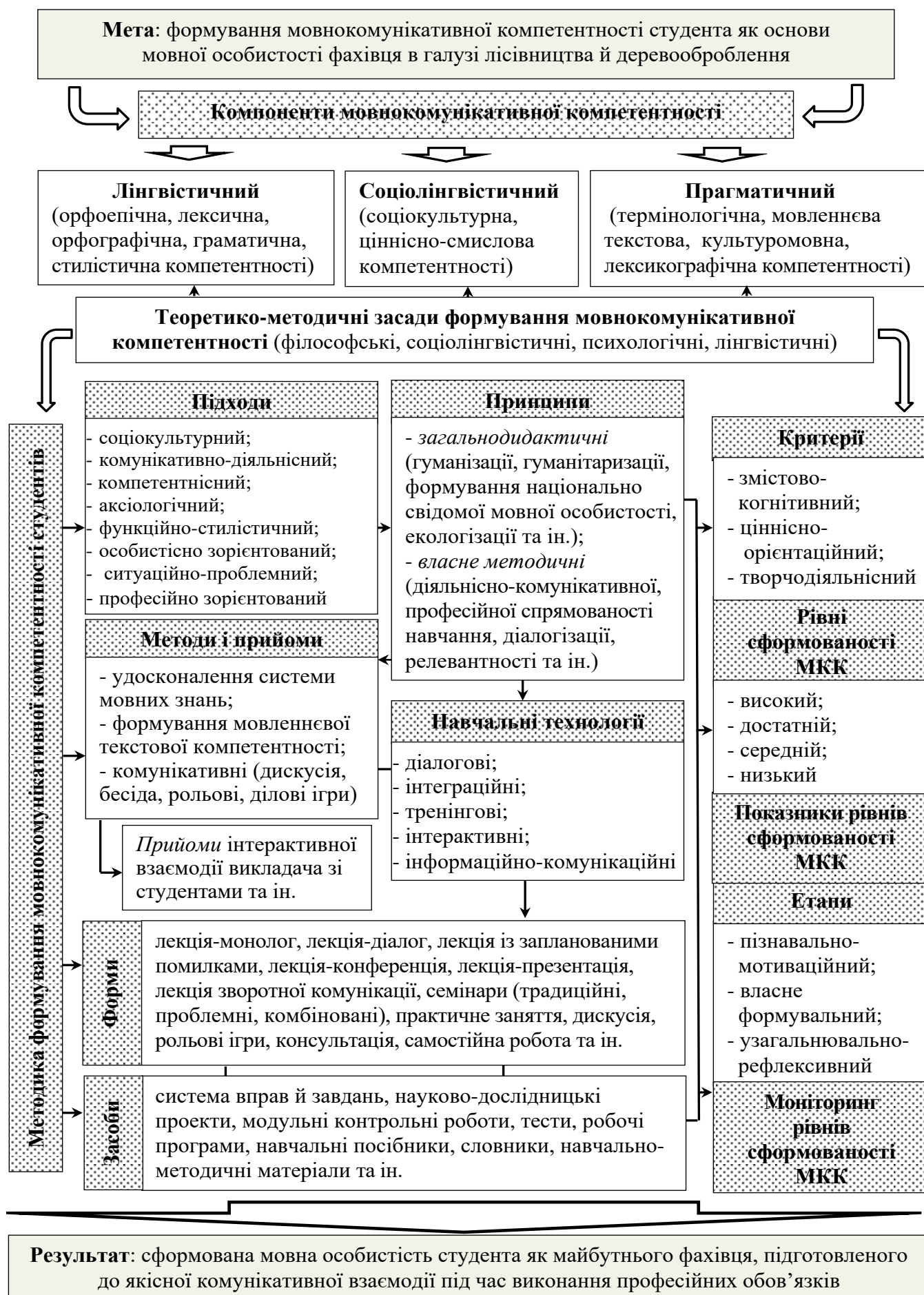
Рис. 1. Модель формування МКК майбутніх фахівців лісотехнічних спеціальностей